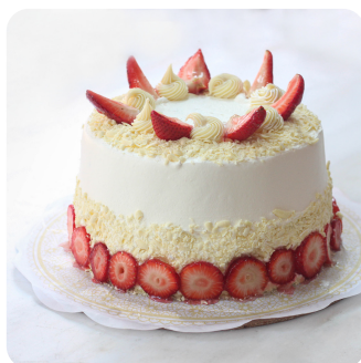
FRESAS CON CREMA

PASTEL DE VAINILLA RELLENO DE TRUFA BLANCA CON MERMELADA DE FRESA